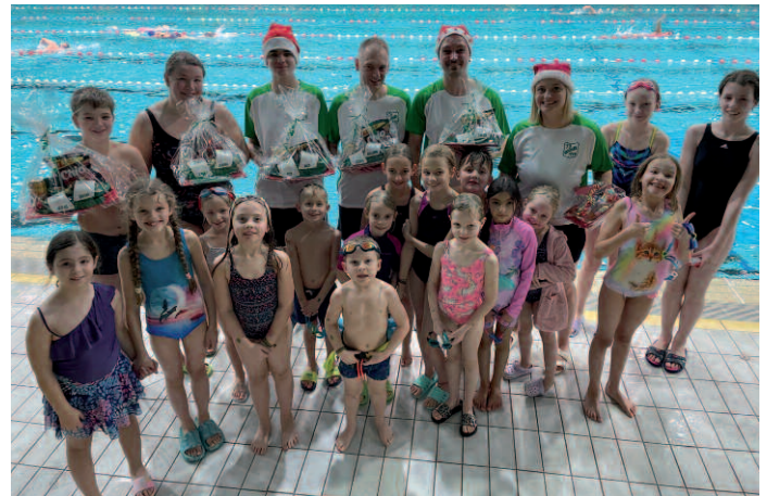
Präsenete für das Leitungsteam...