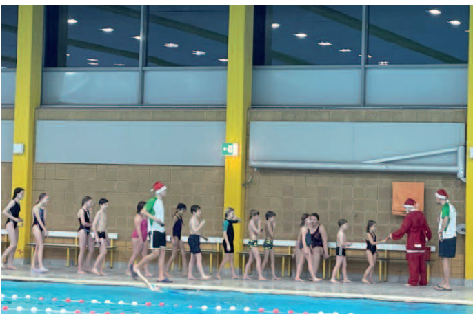
Der Weihnachtsmann kam persönlich vorbei