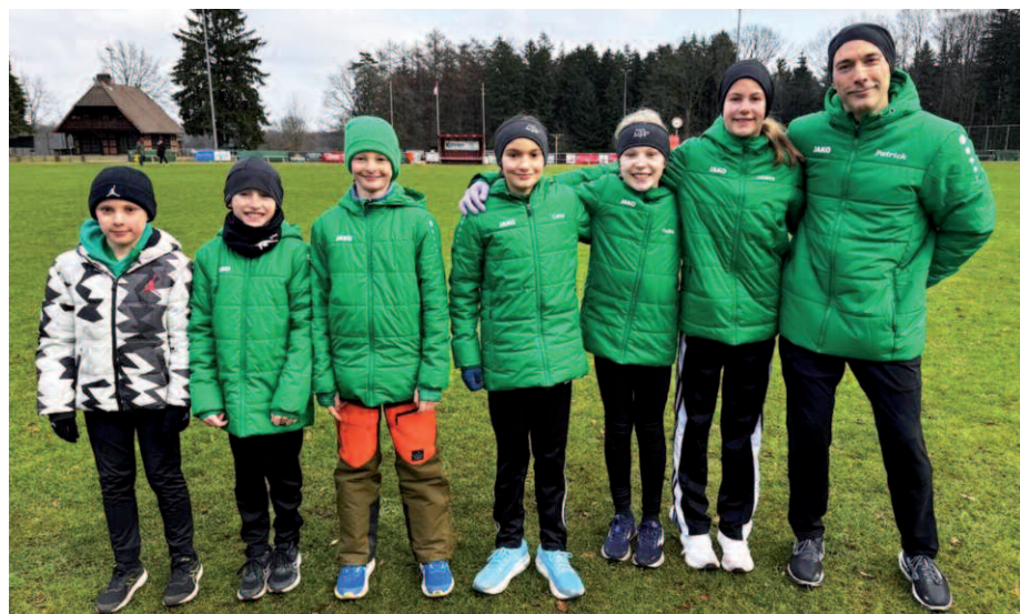
Die Crossläufer trotzten Kälte und schwierigen Streckenbedingungen