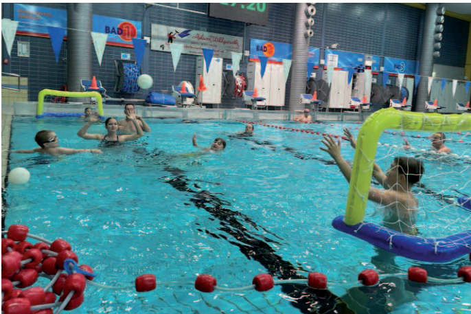
Viel Spaß beim Wasserball