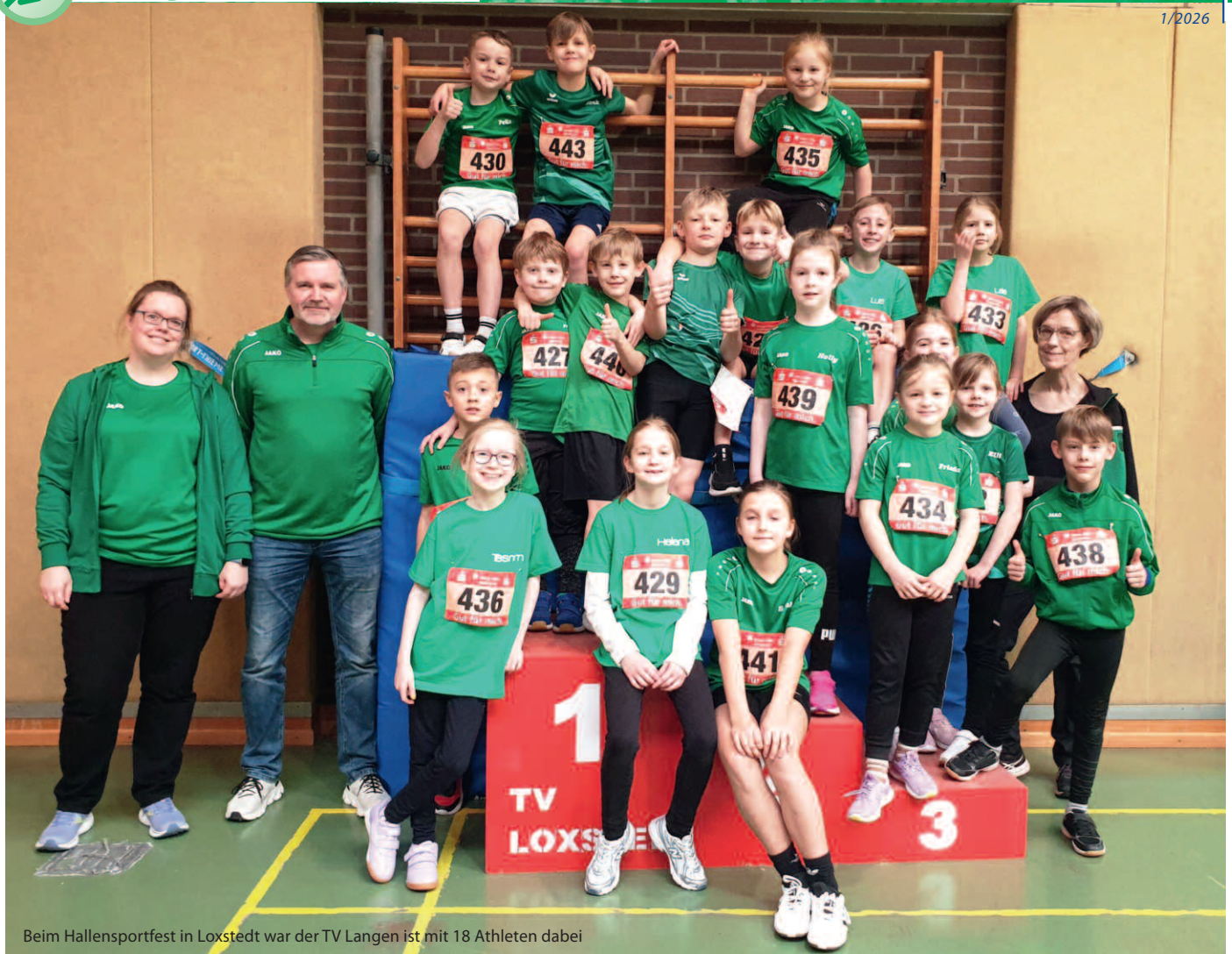
Beim Hallensportfest in Loxstedt war der TV Langen ist mit 18 Athleten dabei