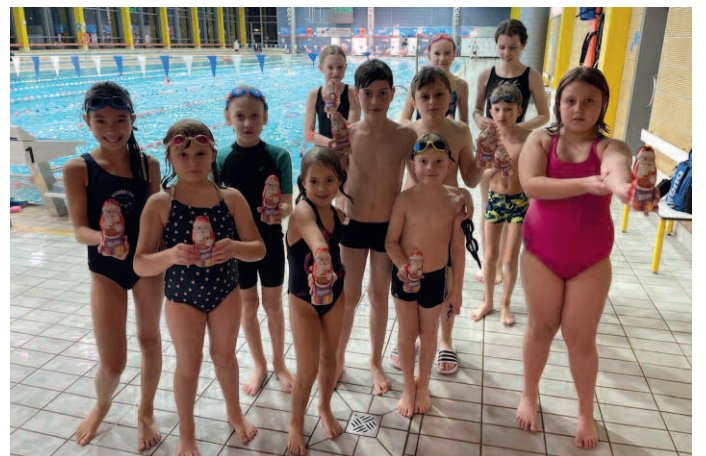
... und Schoko-Weihnachtsmänner für die Kinder