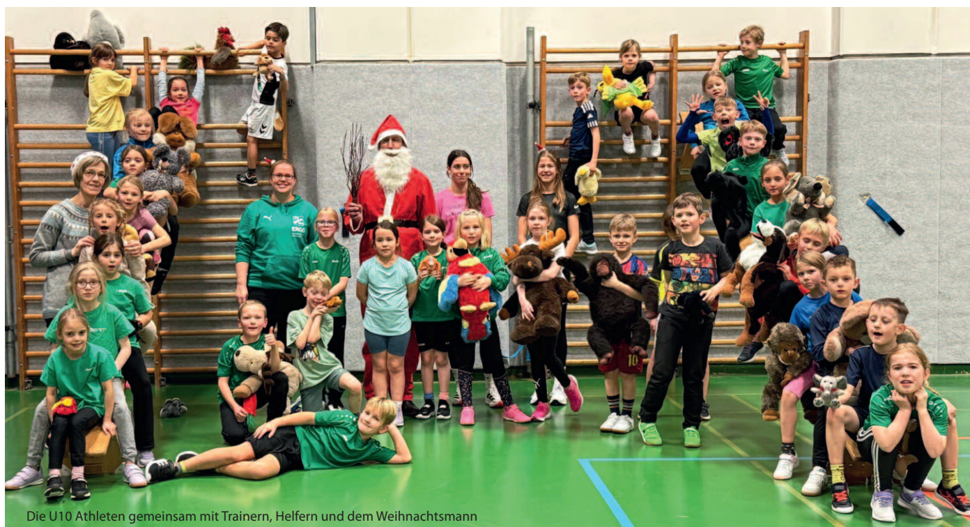
Die U10 Athleten gemeinsam mit Trainern, Helfern und dem Weihnachtsmann