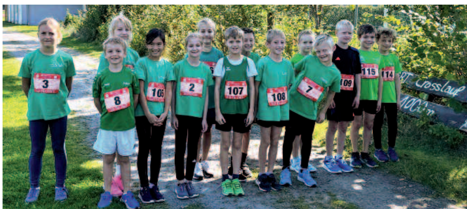
Die U10 nervös am Start