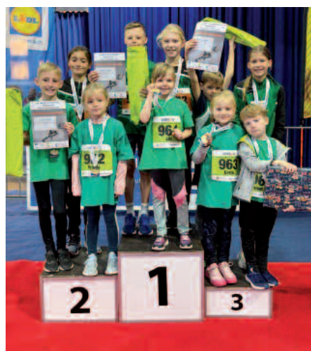
Alle Langener Gesamtsieger auf ihrem Podestplatz