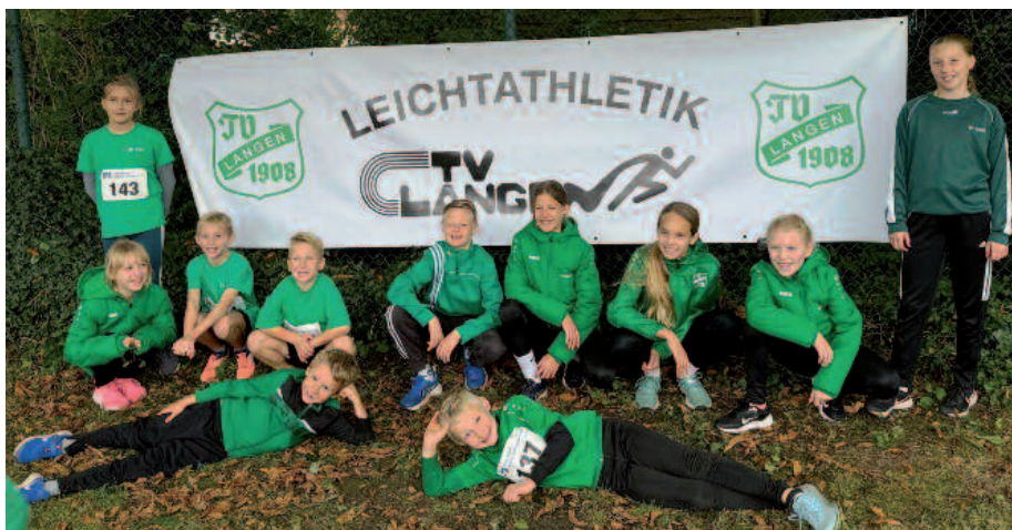
Athleten von U8-U14 starten gemeinsam in Otterndorf auf dem Hadeler Läufertag. Viele Bestleistungen, Titel und ein neuer Kreisrekord