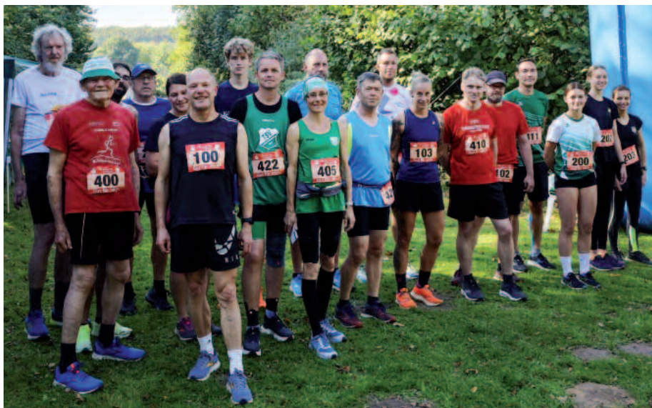
Die Läufer der Crosslaufkreismeisterschaft über 5 km starten gemeinsam mit den Volksläufern über 2500 m, 5000 m, 7000 m und 10.000 m