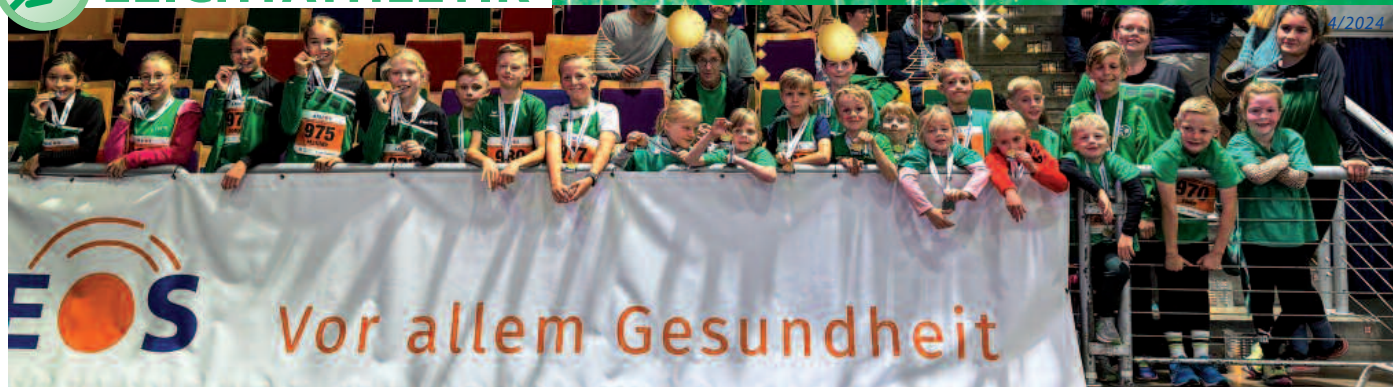
Alle Läuferinnen und Läufer vom TV Langen beim Marathon Bremerhaven