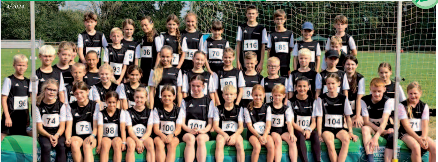
Kreiswahl Cuxhaven mit zahlreichen Langener Athleten