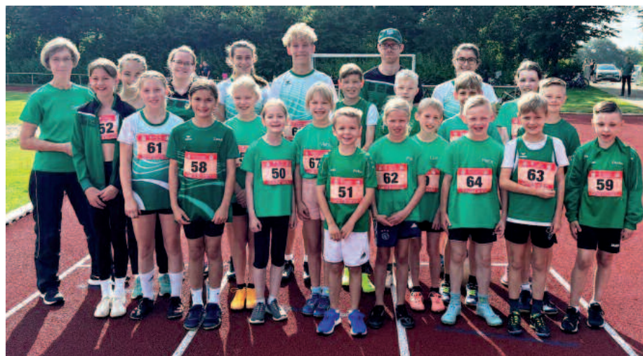
Kreismeisterschaften Mehrkampf und Langstaffel in Loxstedt am 11. August für unsere Athleten