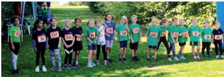
Start der U8 über die 500-m-Strecke