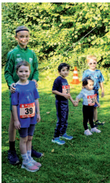
Der Mini-Crosslauf für die Jüngsten