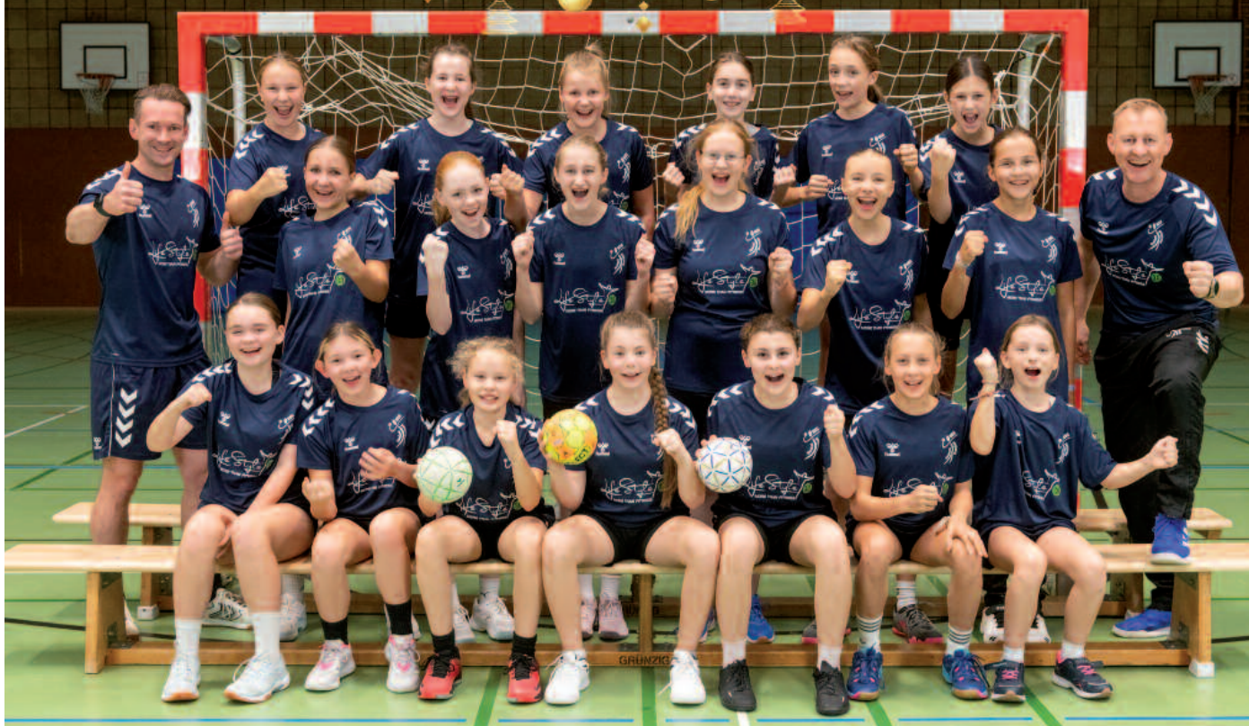
Die neuen Aufwärm-Tshirts der weiblichen D-Jugend