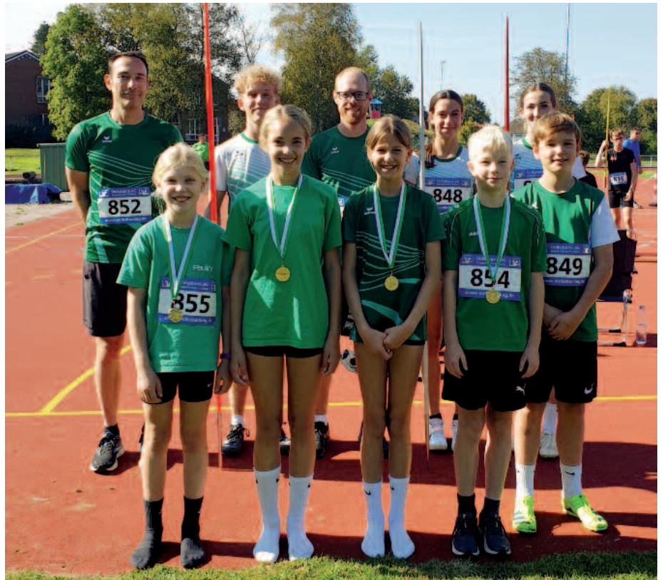
Kreismeisterschaften Wurf als letzter Wettkampf der Freiluftsaison für die U4 und älter. Die U12 trat nochmals im Hoch- und Weitsprung an

Durchstarten im Beruf. Mit dem Weiterbildungsangebot der wisoak in Bremerhaven.