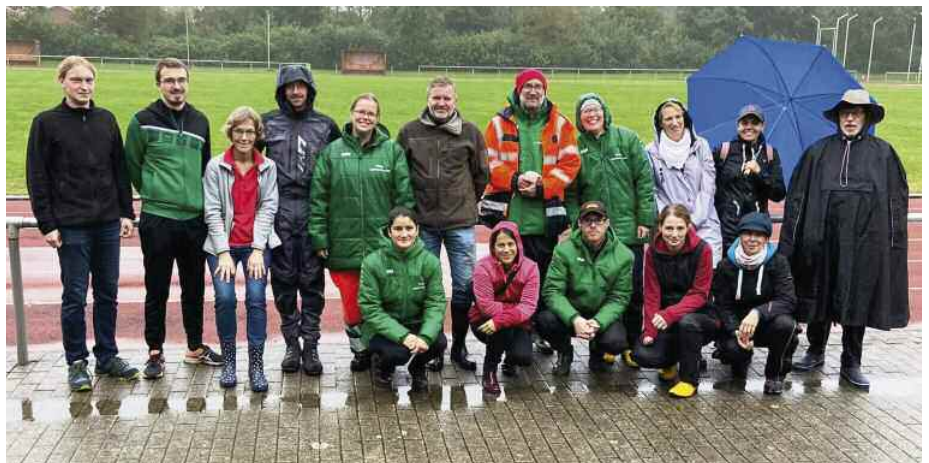
Helferteam Crosslauf Friedrichsruh: Ohne euch geht es nicht – DANKE!