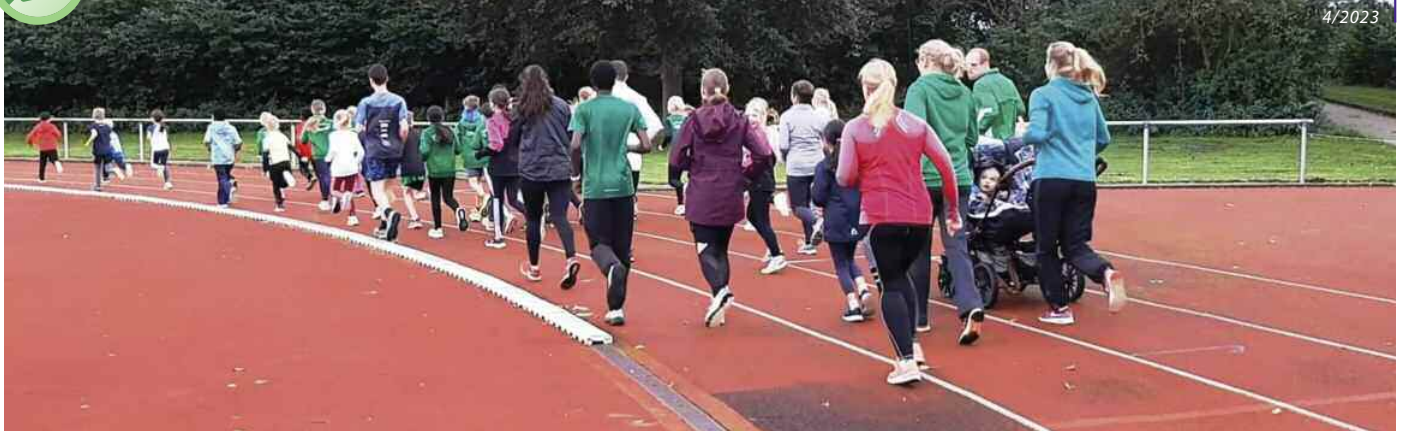
Saisonabschluss Freiluftsaison mit dem traditionellen Ablaufen