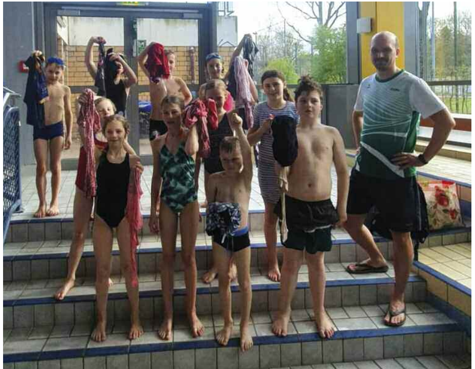
Die Leichtathletik Schwimmgruppe nach dem Klamottenschwimmen

Das Angebot richtet sich an die Kinder und Jugendlichen der Leichtathletikabteilung. Wenn weitere Plätze frei sind, können auch gerne erwachsene Leichtathleten, sowie Eltern (soweit diese ebenfalls im Verein sind) trainieren.