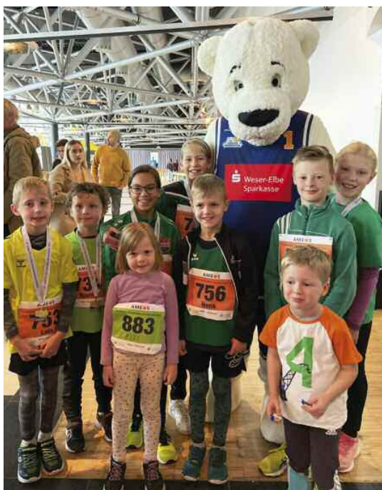
Viel zu entdecken beim Marathon Bremerhaven in der Stadthalle

Den Zielversorgungsstand mit Getränken und Obst übernahm die Leichtathletikabteilung. Das war komfortabler und insbesondere wettergeschützter als der Versorgungsstand an der Strecke im letzten Jahr im Neuen Hafen. Eltern und Trainer versorgten alle Läufer routiniert, hatten viel Spaß und haben so einen kleinen Beitrag für unser Oster-Sport-Camp erwirtschaften können.