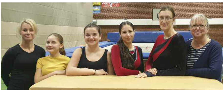
Die Trampolin-Leistungsgruppe trainiert jeden Mittwoch von 17 bis 19 Uhr