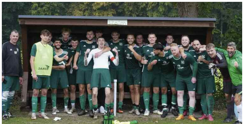
Siege richtig zelebrieren

Im Endspurt der Hinrunde ging es dann am zehnten Spieltag gegen die Dritte des FC Geestland. Auch in diesem Spiel musste wir auf einige Stammspieler verletzungsbedingt verzichten. Die Gastgeber nutzen Ihre Chancen eiskalt aus und fügten uns mit einem 3:1 die erste Saisonniederlage zu. Damit war das kleine Topspiel (Erster gegen Dritter) abgehakt und be-