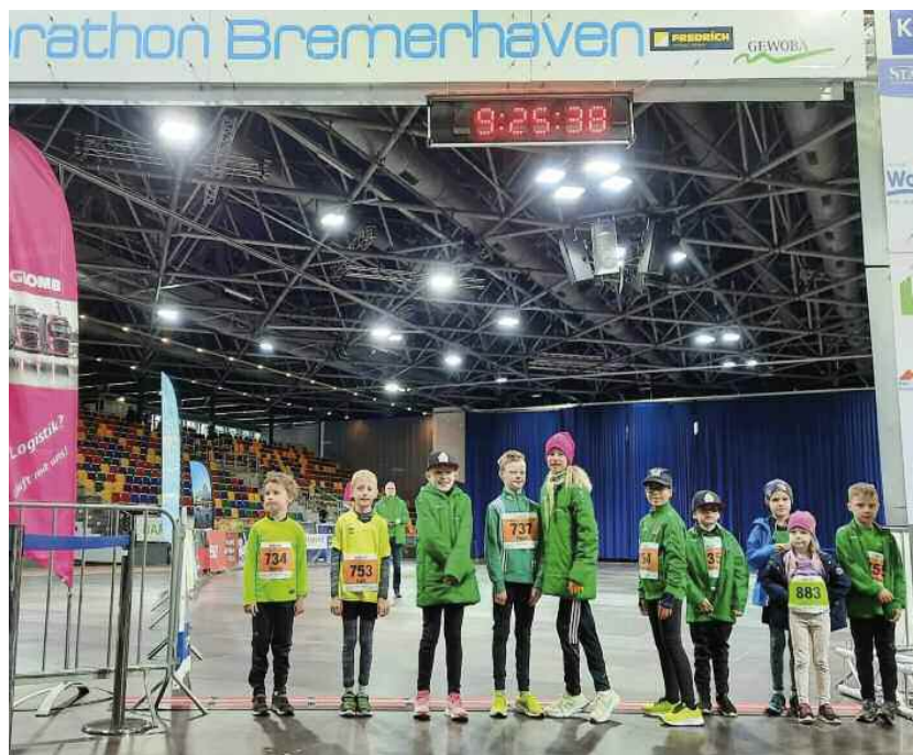
Generalprobe am Start