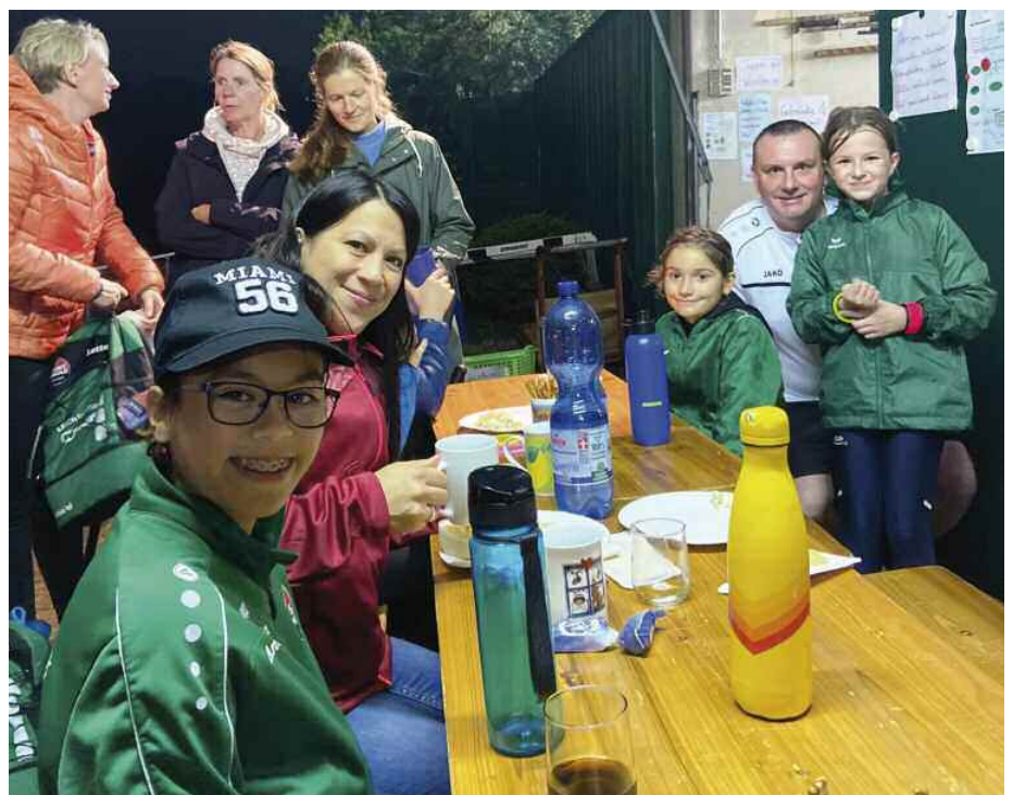
Geselliges Zusammensein von Jung und Alt: Nach dem Ablaufen durfte sich an Grill und Buffet gestärkt werden