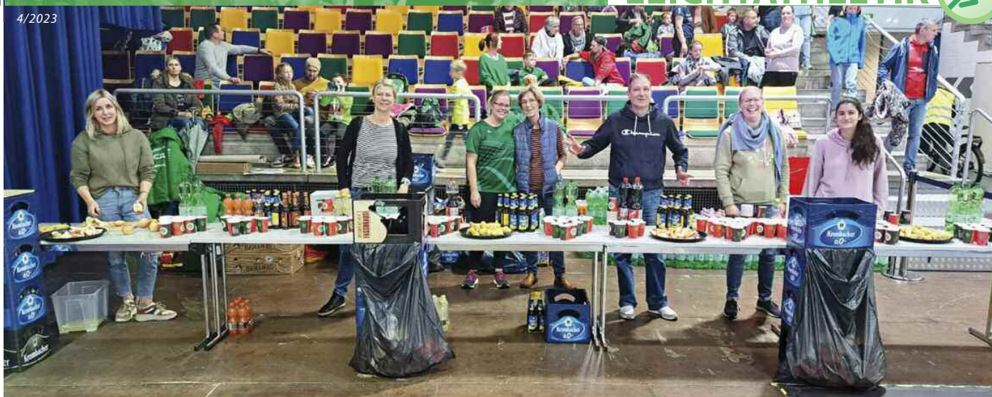
Helferteam am Versorgungsstand vom Marathon Bremerhaven