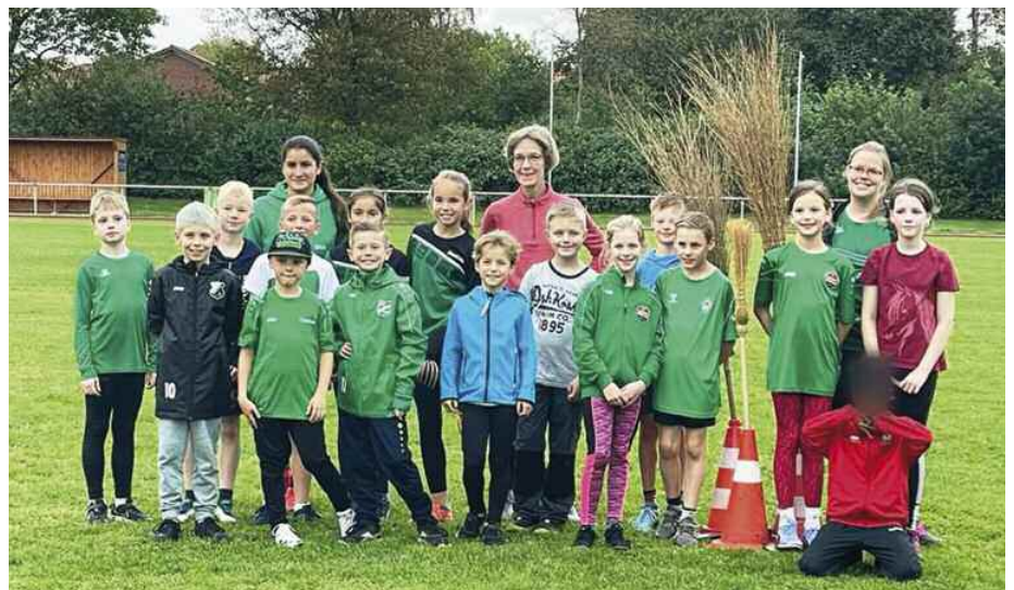
Ausfegen Jahrgang 2014