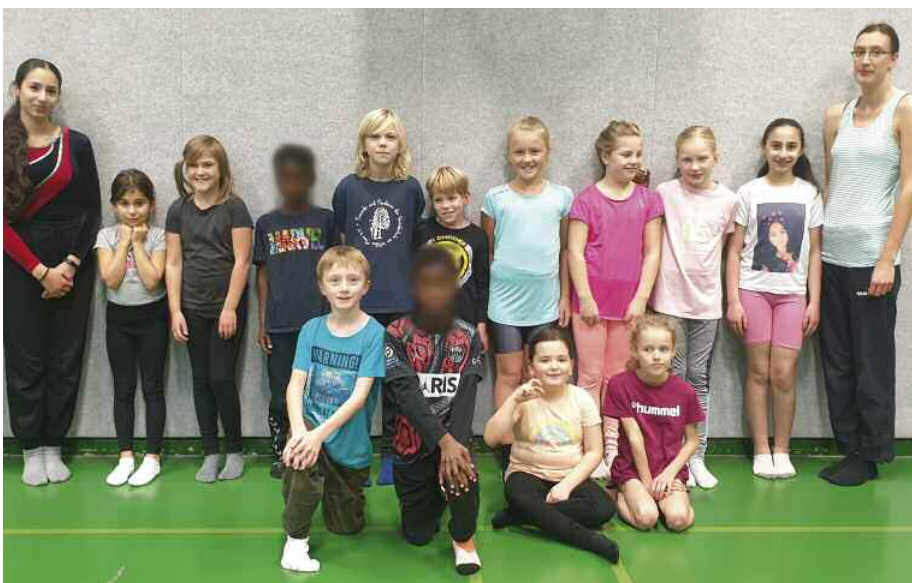
Die Trampolin-Breitensportgruppe für Kinder ab 6 Jahren trainiert immer mittwochs von 15.30 bis 17 Uhr