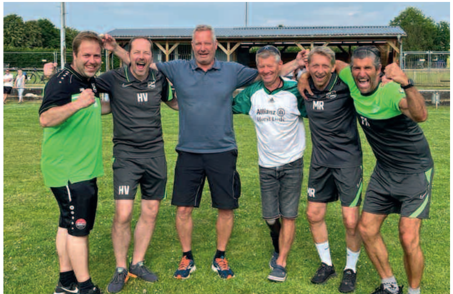
Der Abteilungsvorstand freut sich mit den Trainern über den tollen Saisonabschluss