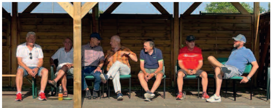
Die treue Expertenrunde am Spielfeldrand