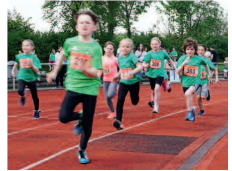
Gemeinsamer Start der W8 und M8