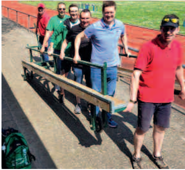
Der Unterbau wird mit Muskelkraft zurückgebracht