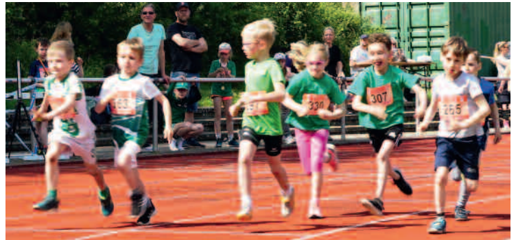
Start unserer jüngsten Läufer und Läuferinnen