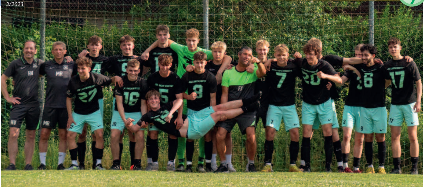
Das letzte offizielle Foto der U19 – ausgelassene Stimmung nach dem Klassenerhalt