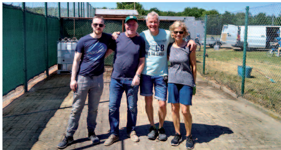
Die fleißigen Helfer bei den Vorbereitungen für das Vereins-Sportfest.

meinsamen Vereinsarbeit! Am Wochenende 24./25. Juni fand dann bei herrlichem Sonnenschein das Vereinssportfest statt. Weil wir unseren Badminton-Sport nicht so einfach nach draußen verlegen können, da auch schon der kleinste Windzug den Federball aus der Flugbahn bringen kann, hatten wir eine andere Lösung gefunden. Wir durften einen der beiden Tennisplätze für unseren Bereich nutzen. Dort wandelten wir das Badminton-Spiel kurzerhand in ein für draußen geeignetes Speedminton-Spiel um. Wir hatten dafür spezielle Schläger zur Verfügung, konnten allerdings genauso mit unseren Badminton-Schlägern spielen. Einer der großen Unterschiede zum Badminton ist dabei der Ball, der beim Speedminton zwar ähnlich aussieht, aber etwas kürzer und schwerer und dadurch windstabiler ist. Außerdem liegt dieser Ball schneller und weiter als einer unserer Federbälle.