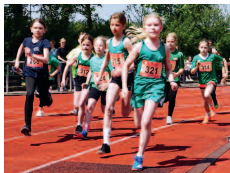
Start 800m der W10