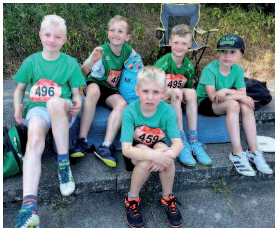
Die 2014er Jungen warten auf die Staffel