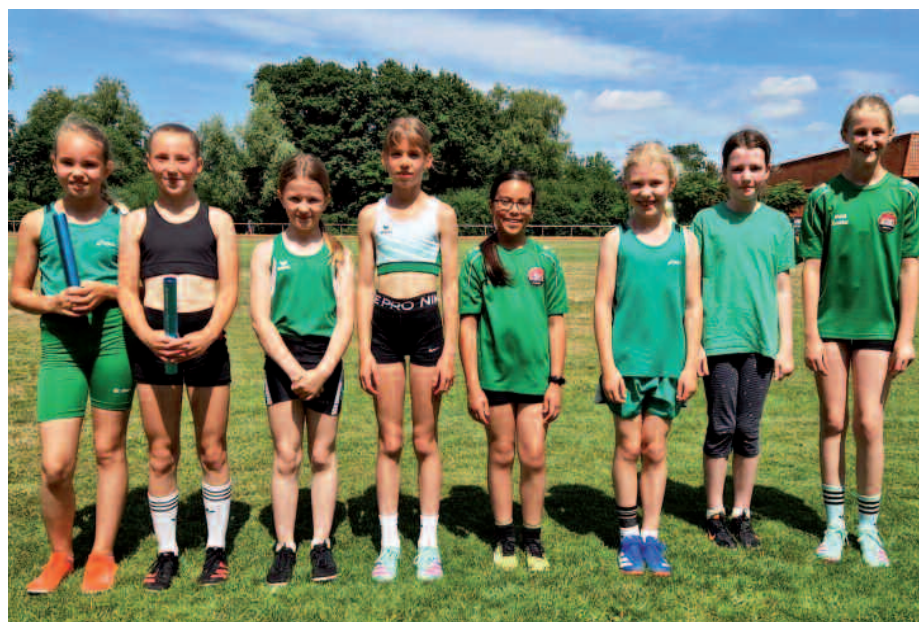
Unsere Mädels in Sottrum